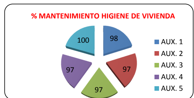
Gráfico 3. Elaboración propia. Abril 2012*