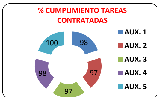
Gráfico 2. Elaboración propia. Abril 2012