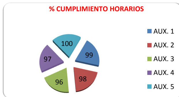
Gráfico 1. Elaboración propia. Abril 2012

Es significativo que todas las auxiliares se encuentran en un baremo entre 97% - 100% en el cumplimiento de horarios, tareas y mantenimiento de la higiene de la vivienda, tal y como se puede comprobar, en los datos desagregados por auxiliar en % relativos a los domicilios atendidos, que se refieren a continuación